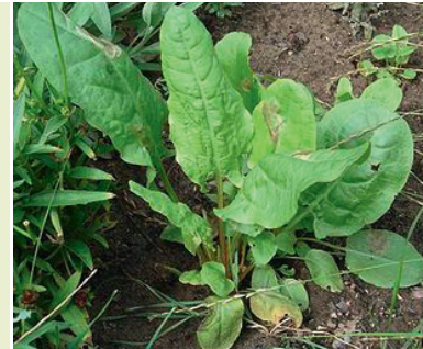
Raupen-Nahrungspflanze: Kleiner Sauerampfer